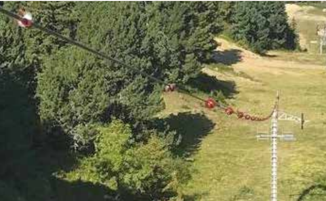
Pose de Birdmarks et flotteurs sur les TSD Casserousse et TK Schuss.