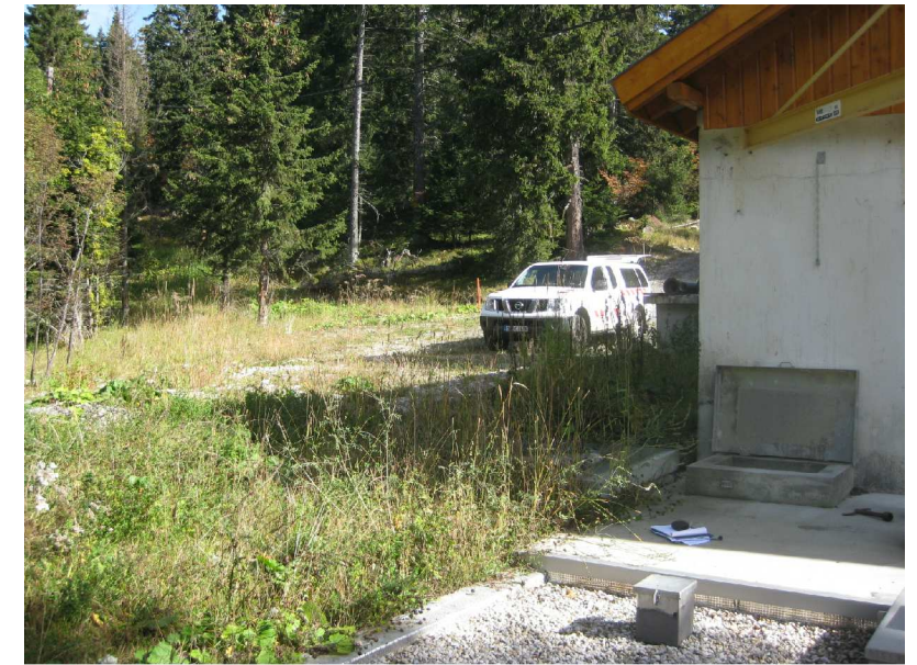
Site du captage et de la bâche de Boulac