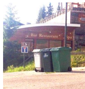
Hiver / printemps 2015

Par ce système de collecte, les conditions de travail des agents sont améliorées, le déplacement des bacs roulants en période hivernale et enneigée étant difficile et dangereux. Enfin, les conteneurs semi-enterrés, recouverts de lattes en bois, s'intègrent parfaitement dans le paysage de la station avec la possibilité pour les habitants, comme pour les touristes, de déposer leurs déchets 24h/24 et 7jours/7.