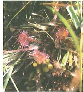
Rossolis à feuilles rondes

Ce site est une mosaïque de groupements végétaux : végétation des bordures de ruisseaux, végétation typique des tourbières et de bas marais (buttes à Sphaignes). Les Sphaignes sont des mousses qui forment des coussins gorgés d'eau. Les parties mortes, à la base des coussins, constituent la tourbe.